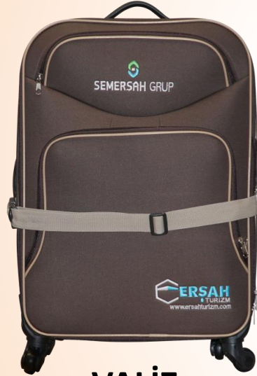
VALİZ EN FAZLA 30 KG

Uluslararası uçuş standartları gereği uçağa belirtilen yükten fazla eşya alınmamaktadır.