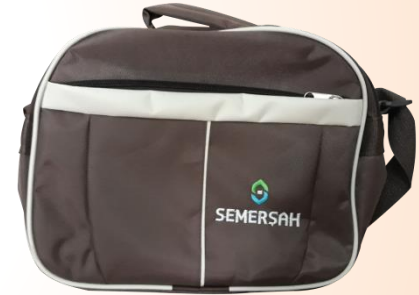
EL ÇANTASI EN FAZLA 8 KG

Uluslararası uçuş standartları gereği uçağa belirtilen yükten fazla eşya alınmamaktadır.